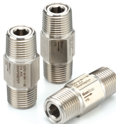
Compact, one-piece body